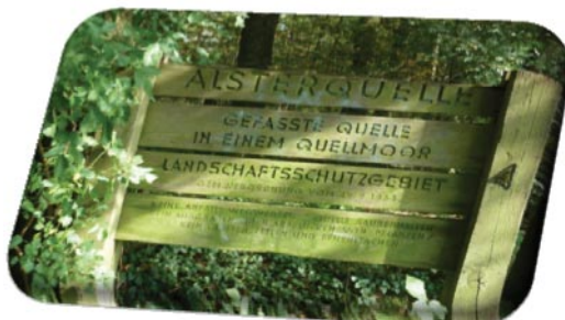
Radtour zur Alsterquelle