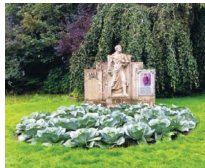
Denkmal des Kohlmuseums

Wir sind schon jetzt gespannt auf den nächsten Tagesaus- flug 2014.