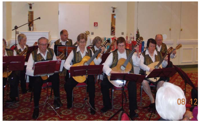
Das Hamburger Mandolinorchester