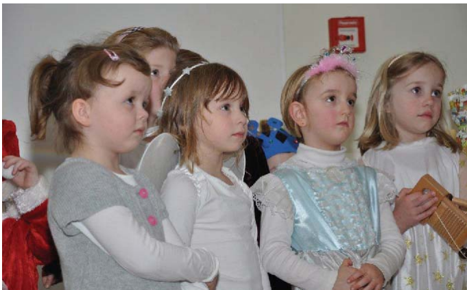
Gespannt warten die Kinder auf die Belohnung